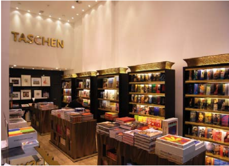
Luxus als Konzept: Der Taschen Verlag setzt mit teuersten Produkten fort, was er ursprünglich mit billigen begann – Inspiration in Buchform. Das gilt auch für seine Stores im Star-Design wie hier in Hamburg

Vorstellung, die Buchindustrie lebe im wesentlichen von „Need“-Produkten, ist schon lange überholt. Der Buchmarkt entwickelt sich seit etwa zwanzig Jahren von einem „Need“- zu einem „Want“-Markt.