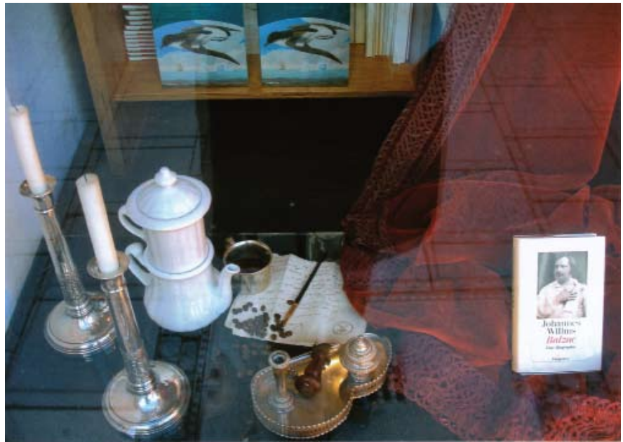
Buchhandel auf dem Weg vom „Need“- zum „Want“-Markt: Die Balzac-Biografie „braucht“ man nicht unbedingt, aber so wie sie bei Literatur Moths in München inszeniert wird, möchte man sie haben

„Etwas stimmt nicht mehr. Mein Kopf kommt nicht mehr mit ... Das Verhältnis meines Gehirns zur Informationsflut ist das der permanenten würdelosen Herabstufung. Ich spüre, dass mein biologisches Endgerät im Kopf nur über eingeschränkte Funktionen verfügt und in seiner Konfusion beginnt, eine Menge falscher Dinge zu lernen ... Ich lebe ständig in dem Gefühl, eine Information zu versäumen oder zu vergessen, und es gibt kein Risiko-Management, das mir hilft. Und das Schlimmste: Ich weiß noch nicht einmal, ob das, was ich weiß, wichtig ist, oder das, was ich vergessen habe, unwichtig.“