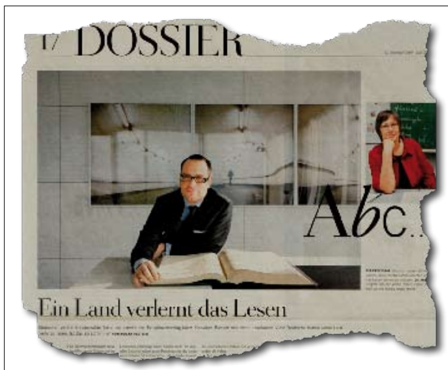
ZEIT-Dossier: Auch außerhalb der Buchbranche nimmt man inzwischen „ein sich epidemisch ausbreitendes Lese-Prekariat“ wahr

Nur: Die Strategie des „Emporlesens“ funktioniert immer unzuverlässiger, weil der Arbeitsmarkt inzwischen selbst für Gutgebildete hohe Barrieren bereithält. Und: Funktionales Lesen wird immer mehr online praktiziert. Gerade zur Informations- und Wissensvermittlung verleitet das Internet mit unschlagbarem Komfort,