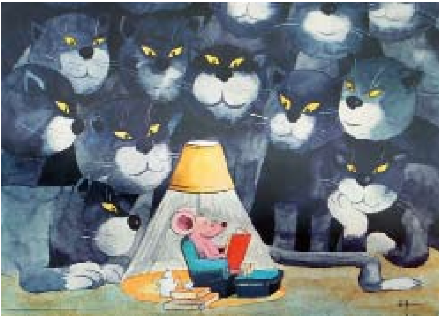
Ein Szenario für 2020: Wird das scheinbar nutzlose Vergnügungslesen, bei dem man die Welt um sich herum vergisst, neu bewertet – als Königsweg des persönlichen Wachstums? (Illustration: Helme Heine)

als Filialsystem zu führen ist die größte Herausforderung – aber Firmen wie Ernstings (Textil) zeigen, dass auch das möglich ist.